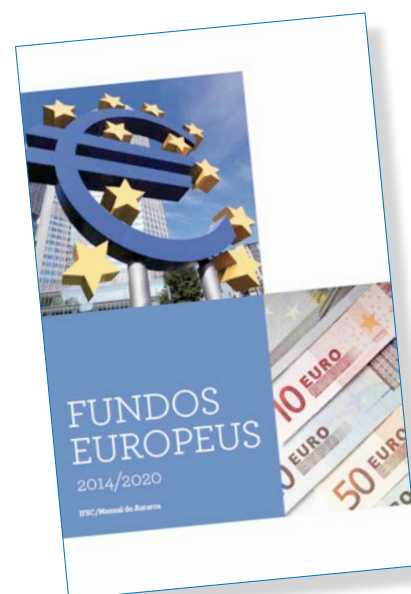
(Capa do volume sobre os Fundos Europeus do Manual do Autarca)

Os livros para venda estarão disponíveis brevemente na livraria do site do Instituto.