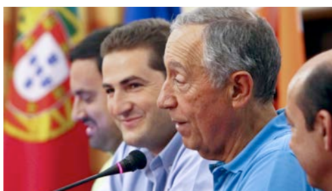
Marcelo Rebelo de Sousa fala do PSD e da Democracia