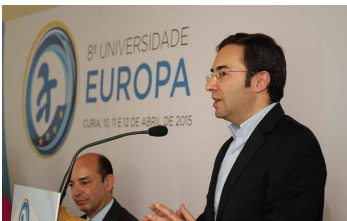
O evento foi encerrado pelo Ministro do Ambiente, Ordenamento do Território e Energia, Jorge Moreira da Silva