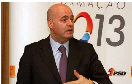
Compromisso Eleitoral (Dep. Paulo Mota Pinto)